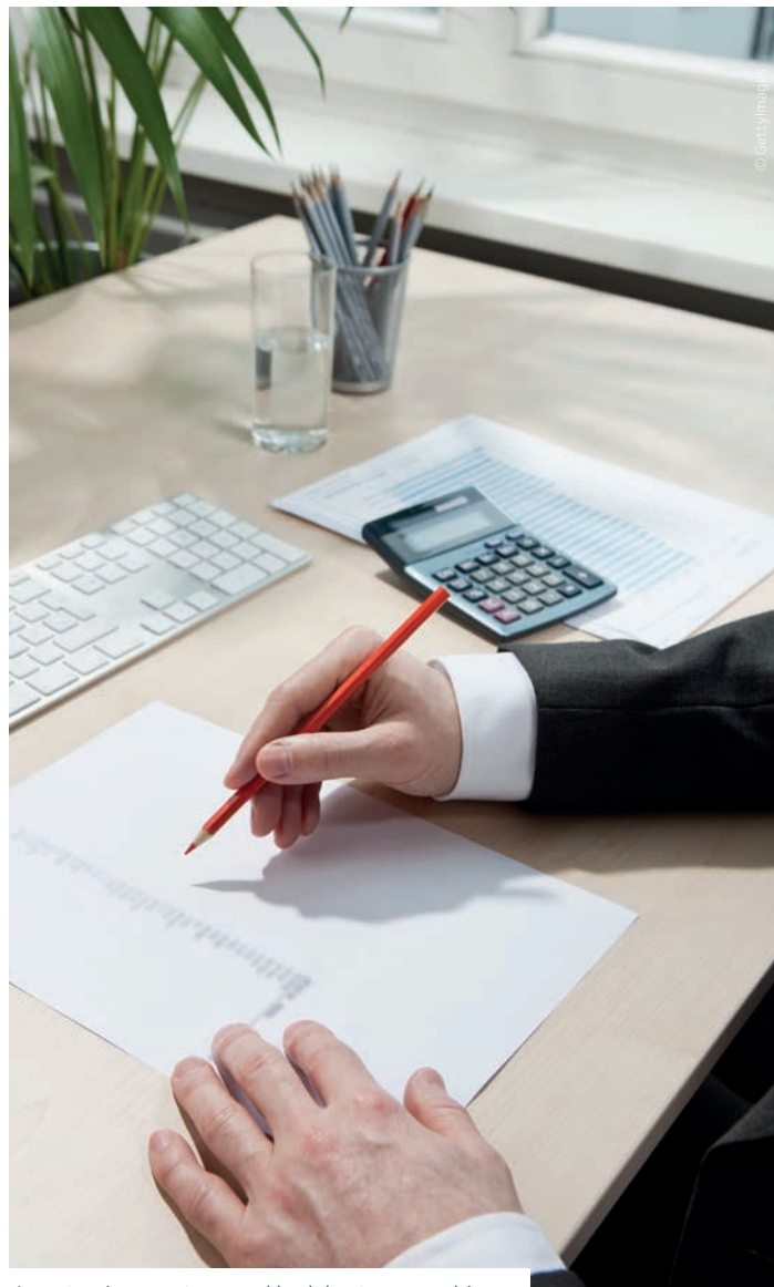
Les entreprises seront responsables de la retenue sur salaire.

En savoir plus sur www.economie.gouv.fr/prelevement-a-la-source