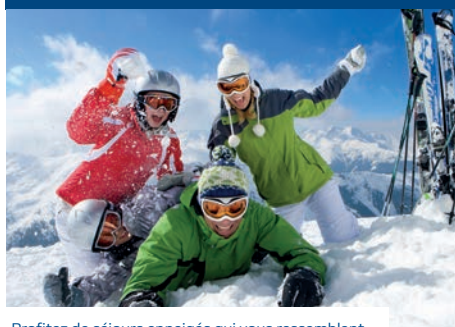
Profitez de séjours enneigés qui vous ressemblent.

Si vous ou vos salariés avez au moins trois enfants âgés de 0 à 17 ans inclus, vous pouvez bénéficier, sous certaines conditions, de 200 € de réduction pour un séjour en établissement locatif et de 300 € de réduction pour toute autre formule de séjour. Profitez-en ! Conditions et tarifs en page 87 du catalogue Vacances Hiver 2018-2019 sur www.probtp.com/vacances